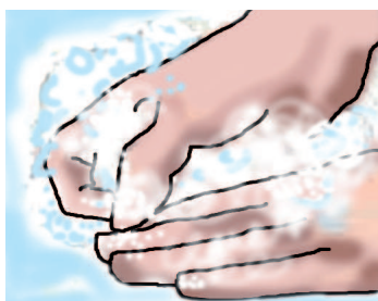
Lava tra le dita, sotto le unghie e il dorso delle mani