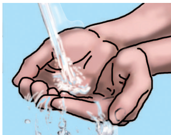
Bagna le mani